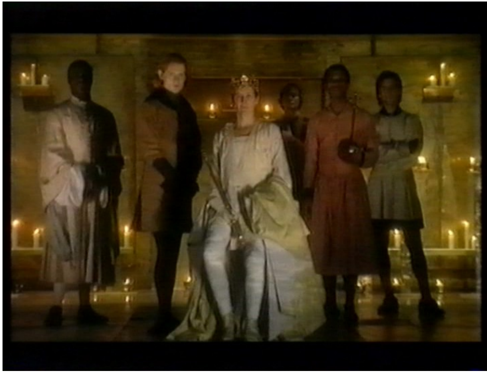
ILLUSTRATION 3 Fiona Shaw dans Richard II mis en scène par Deborah Warner (1995).

Le costume de Richard est blanc et soutenu par des accessoires royaux. Il est également connecteur avec celui des ces suivants qui forme un groupe identifié. (Vecteur accumulateur)